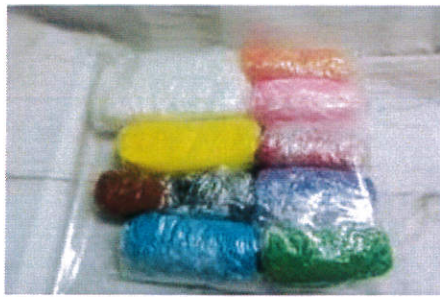
( 幼兒園組 )